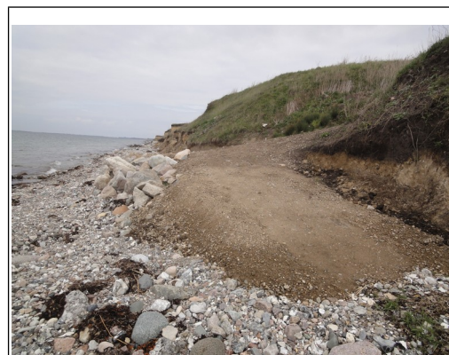
Nedkørsel inden Ingolf kom forbi.

at det er en betingelse for erstatning efter stormflodsordningen, at det beskadigede har en gyldig brandforsikring. Da der er tale om en nedkørsel fra et fællesareal, er denne betingelse ikke opfyldt.