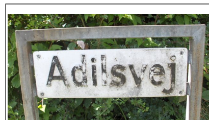
Adilsvej fik en makeup!