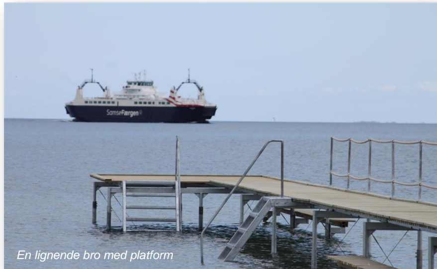
En lignende bro med platform

En mandag i begyndelsen af november blev jeg ringet op af en journalist fra Nordvestnyt (Sjællandske Medier), der gerne ville have min kommentar til den bevilling på 170.500 kr fra Få det Fikset puljen vi havde modtaget. Et wake up call. Journalisten havde tjekket kommunens hjemmeside og her fremgik det, at vores ansøgning var imødekommet. Fantastisk positivt, at Kalundborg